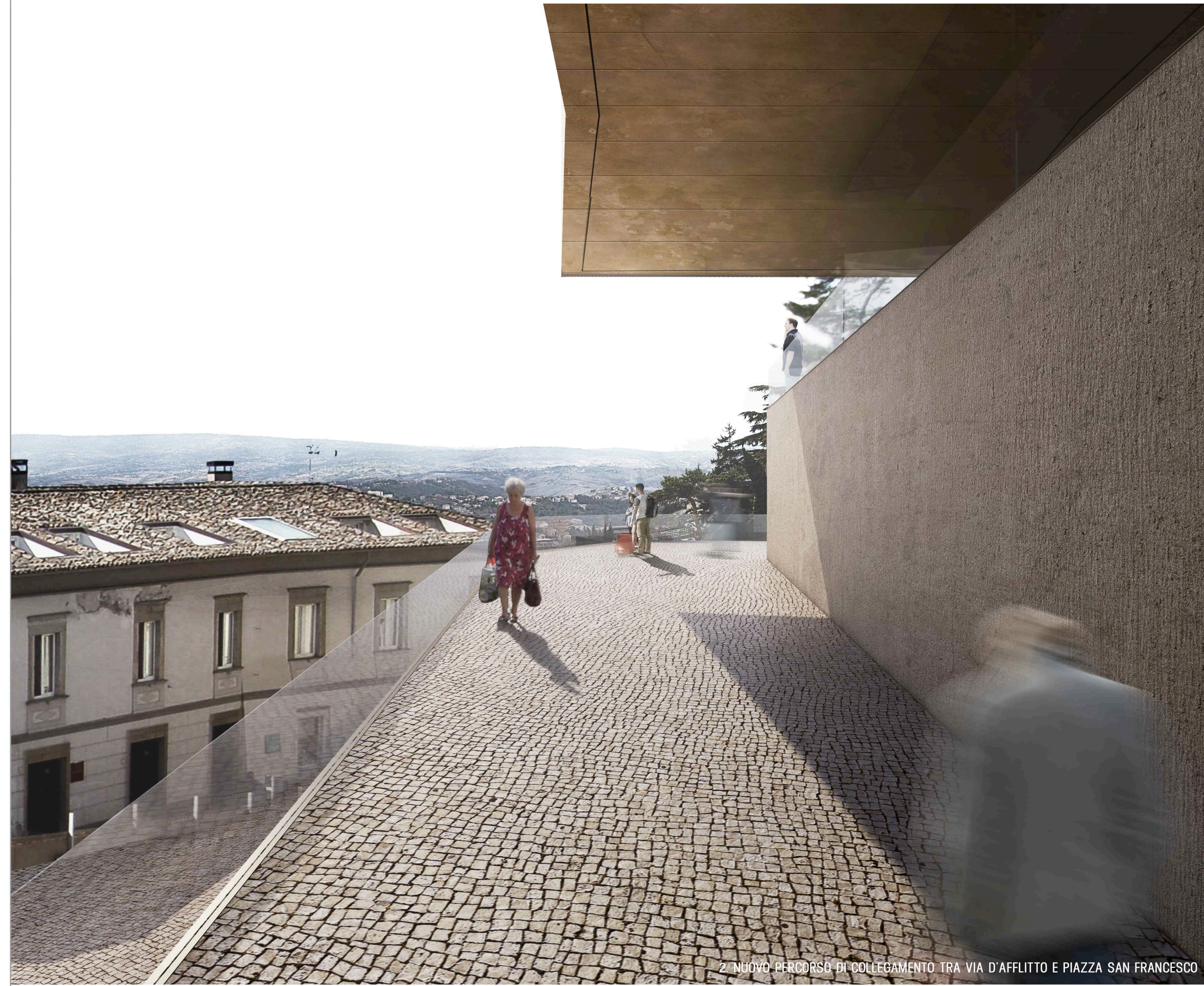
2. NUOVO RI-ORDINO DI COLLEGAMENTO TRA VIA D'AFFLITTO E PIAZZA SAN FRANCESCO