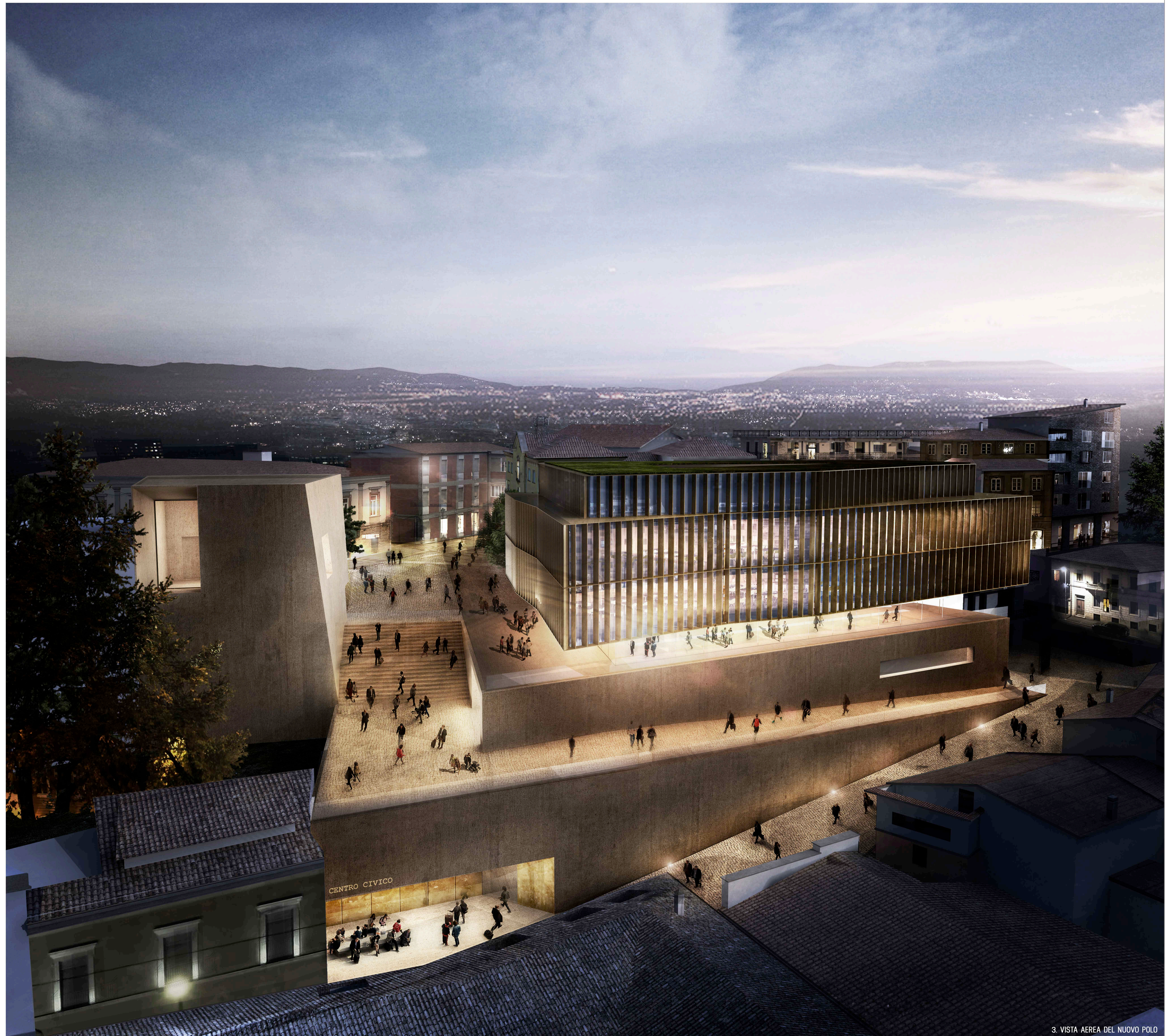
3. VISTA AEREA DEL NUOVO POLO